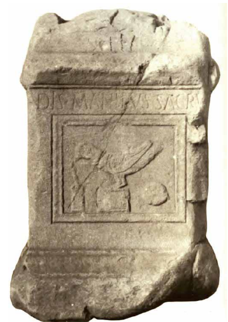
Altar doméstico romano. Hübner, CL II, 3.578. Partida de La Pila. Altea. Depositado en el Museo San Pío V. Valencia.

Las inscripciones funerarias y las aras domésticas dan muestra de una sociedad bien asentada y culta.