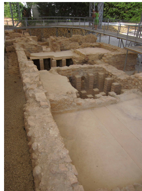
Yacimiento de la Villa Romana de l'Albir

El viajero que llegase por la calzada romana a la zona de Altea, se encontraría una zona sosesgada, custodiada por las atalayas del Mascarat al norte y punta de l'Albir al sur. Los navíos también tendrían cobijo en los fondeaderos de l'Olla, el Portet, l'Albir o Cap Negret.