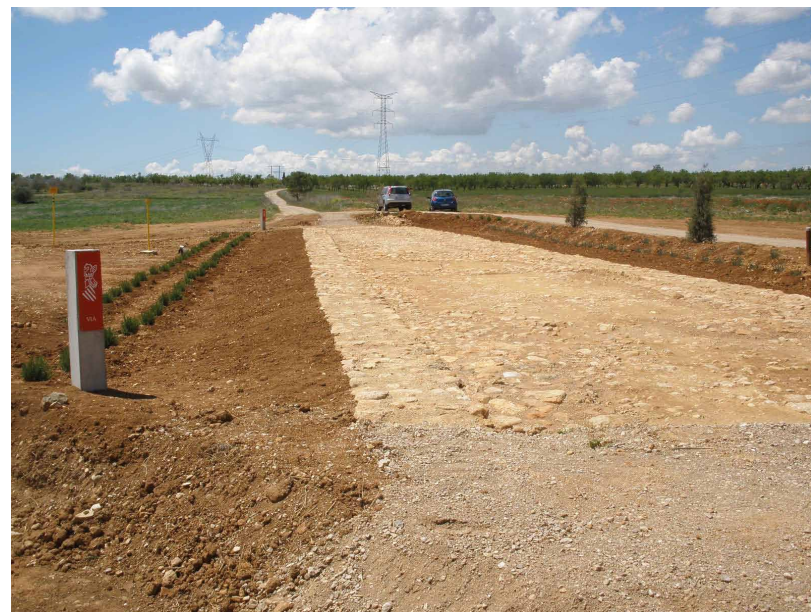
TRAMO DE CALZADA REPUESTO EN BENLLOCH (CASTELLÓN)