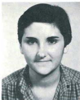
LA ESCUELA DE MUSICA “BENJAMIN PALENCIA” DA SUS FRUTOS

- Des de la teua llarga experiència, com ha evolucionat a nivell