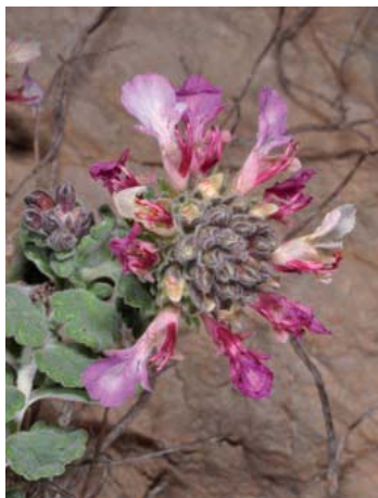
Teucrium buxifolium subsp. hifacense. Important endemisme rupícola. Joan Piera Olives

El Parc Natural de la Serra Gelada i el seu entorn litoral fou declarat l'11 de març de 2005, amb 5.655 ha. de les quals 4.920 són de praderies de Posidonia oceanica , fet molt singular ja que és l'únic parc marítim terrestre declarat a la Comunitat Valenciana. Entre els seus valors ambientals