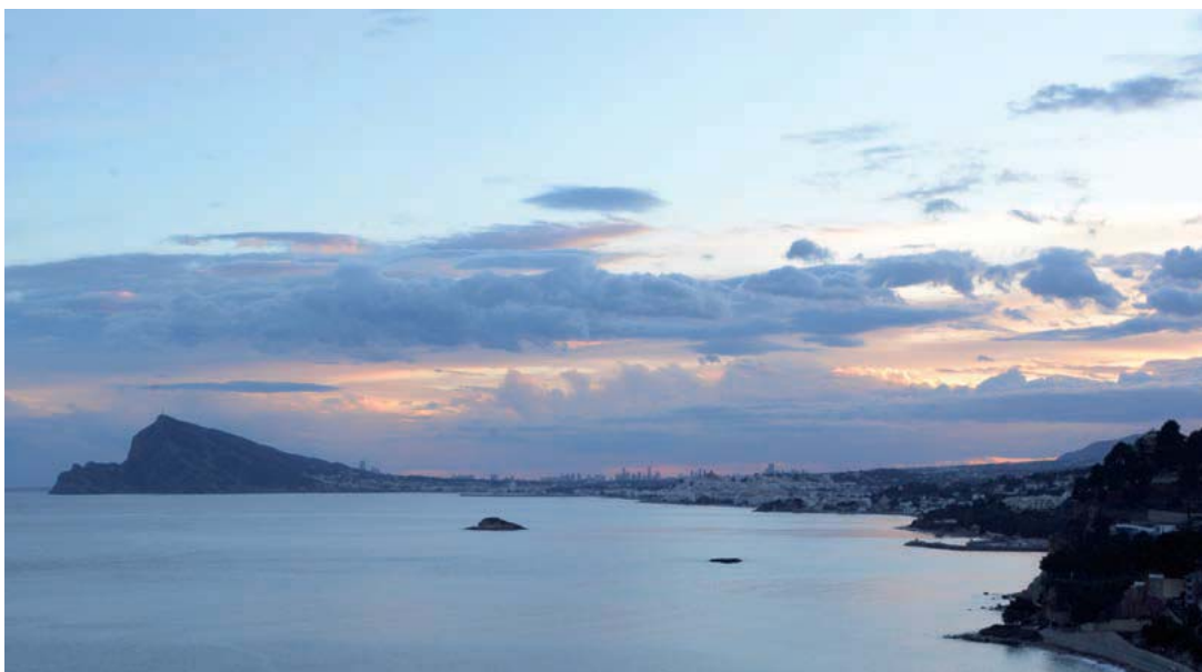
Badia d'Altea i Serra Gelada, un important patrimoni científic. Joan Piera Olives

I a casa nostra també tenim una problemàtica ambiental motivada, entre altres causes, per l'espectacular desenvolupament urbanístic iniciat als anys 60 del segle passat, especialment a la costa, que s'ha emportat per davant importants ecosistemes com són els dunars, entre altres. Alterar la primera línia de